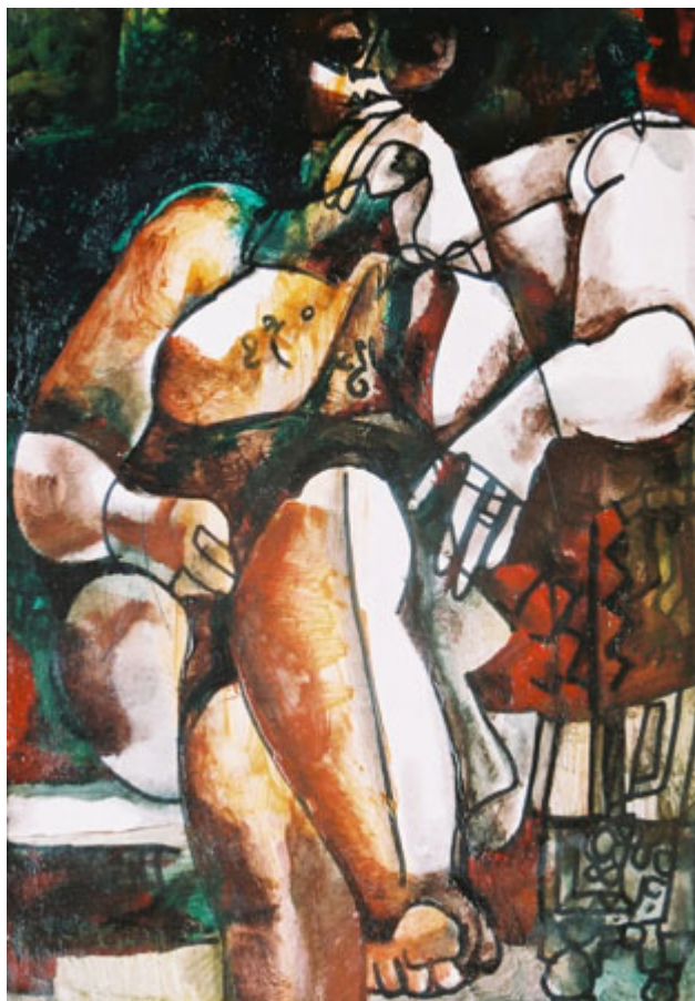
Obra de George Bahgoury

Además del Festival Internacional de Cine de El Cairo, Egipto organiza una de las actividades más importantes del Medio Oriente, con más de 3000 expositores y 3 millones de visitantes internacionales por año, la "Feria internacional del Libro", una de las ferias más antiguas y grandes del Medio Oriente. El evento ofrece la posibilidad de trueque de libros, ayuda a eliminar obstáculos antes de lanzar los libros al mercado, fomenta los debates sobre métodos recientes que facilitan la propagación de cultura y pensamientos.